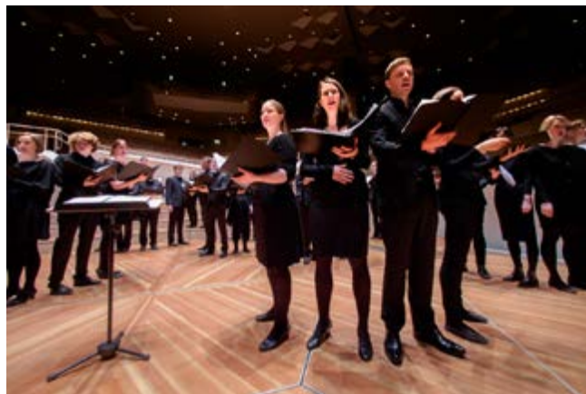
Chor des Jungen Ensembles Berlin

stilistische Spektrum, das der Chor mit Repertoire nur aus dem 20. und 21. Jahrhundert präsentierte: Mit jedem Werk wurde den staunenden Gästen gleichsam ein neues klangliches und stilistisches Kapitel aufgeschlagen. Besonders anrührend gelang – nach teilweise hochkomplexen Sätzen von Z. Randall Stroope und Sven-David Sandström – der von