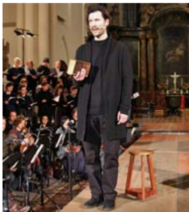
Uraufführung der oratorischen Collage „Frei und niemand untertan“ in der St. Marienkirche Berlin