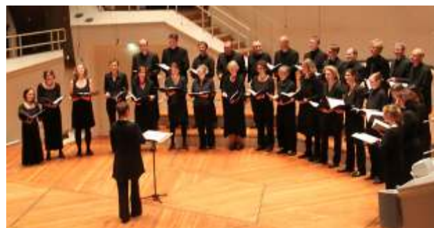
neue chor berlin