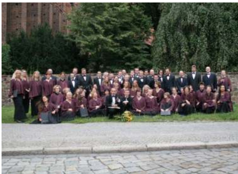
Chor der Humboldt-Universität zu Berlin