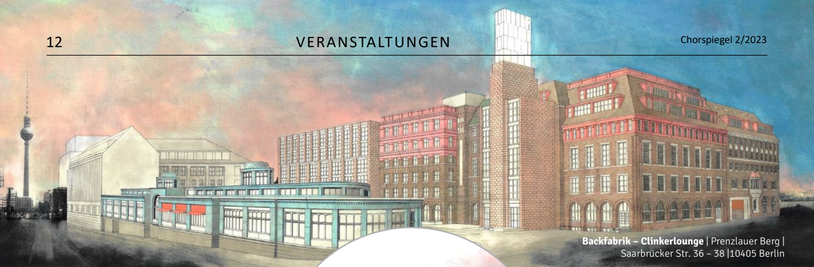
Backfabrik – Clinkerlounge | Prenzlauer Berg | Saarbrücker Str. 36 – 38 | 10405 Berlin

W ir haben die Chance, einen besonderen Ort mit einer über 100jährigen Geschichte entdecken, bespielen und besingen zu können.